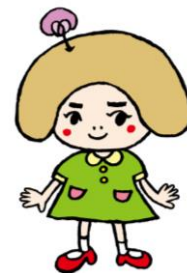
オリジナルキャラクター きなこちゃん