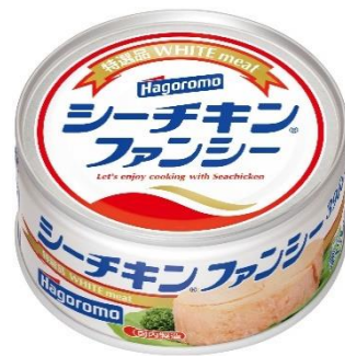
現在販売しているシーチキンファンシー