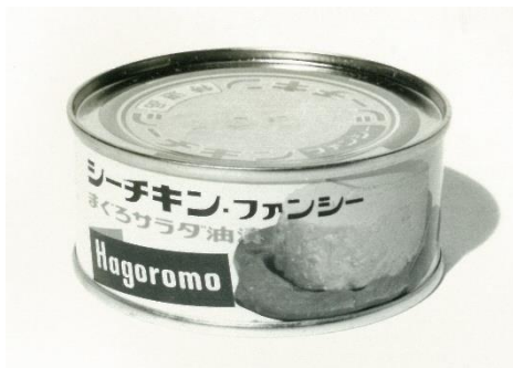
発売当初のシーチキンファンシー

「シーチキンファンシー」は、夏の太平洋を黒潮に乗って日本近海まで北上する旬の「びんながまぐろ」を使用したシーチキンの特選品です。まぐろ缶詰の最高級原料と言われる「びんながまぐろ」をほぐさず缶詰に詰め、魚肉の味に合わせてまろやかな綿実油を使用した油漬タイプのシーチキンです。