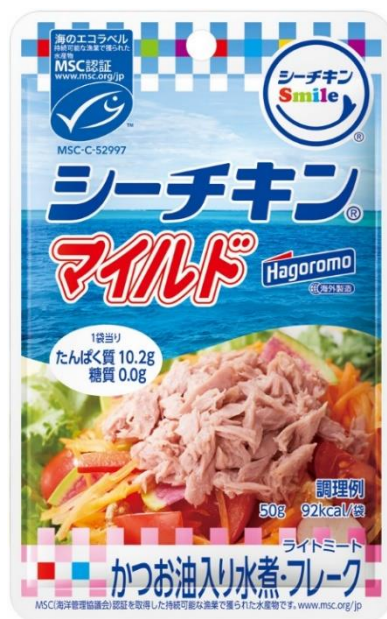
海と自然を意識したパッケージ

【一本釣り】とは、マグロなどの大型回遊魚を、一匹ずつ釣竿を使って釣るため、一般的に混獲率が低い漁法です。MSC認証を取得した一本釣り漁業では、持続可能な水準で漁獲を行っており、これらの魚種資源が健全に保たれるようになっています。