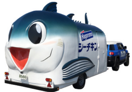
※シーチキン号 シーチキンの原材料のまぐろの一種「びんながまぐろ」をモチーフ

本活動を通じて、今まで以上に身近にシーチキンにふれあっていただき、特にファミリー層のお客様を中心に、ブランド訴求・SNS への話題提供等を行い、更なるファンの獲得を目指します。