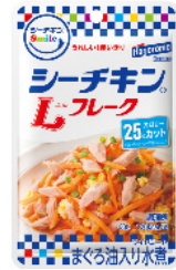
当社製品 「シーチキン Smile L フレーク」