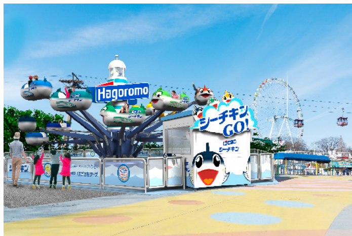
「シーチキン GO！」完成イメージ