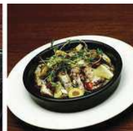
キングオスカー オイルサーディンと ドライトマトのオープン焼き