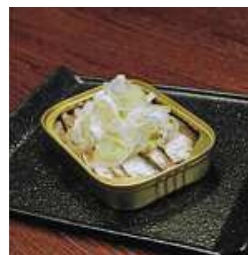
キングオスカー オイルサーディンと ねぎ塩