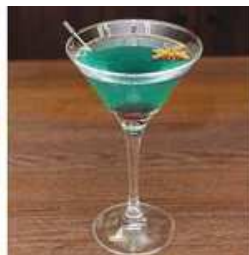
超 A 級スナイパー