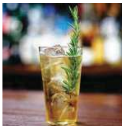
ゴルゴハイボール

首都圏に店舗を展開する「日比谷 Bar」とコラボし、リアル「BAR ゴルゴ」が期間限定でオープンします。ゴルゴ13をイメージしたオリジナルドリンクや、劇画レシピの一部のフードメニュー等をリアル空間で楽しめます。